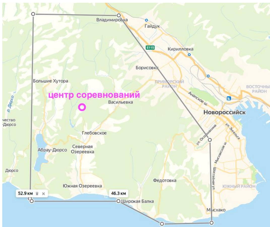
Схема района с расположением центра соревнований

Соревнования проводятся 29-31 октября 2021 г. на территории Новоросийского района. Базовый лагерь и старт в районе с.Глебовка.